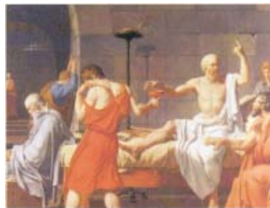
Sokrates erhält den tödlichen Schierlings-Becher

zwar günstig beeinflussen, ohne deren Anwendung der Patient jedoch auch allein mit symptomatischen oder intensivmedizinischen Maßnahmen behandelt werden kann (Tab. 3).